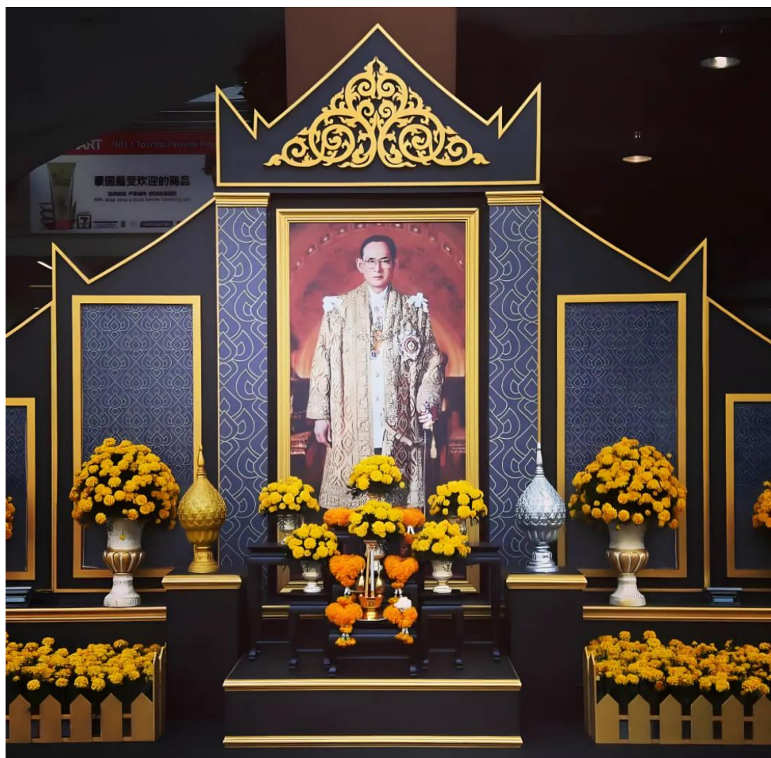
泰国国王普密蓬哀悼会

泰国的葬礼花艺融合佛教信仰与丰富的文化习俗。在葬礼仪式中，花艺不仅是装饰，更是一种象征，体现出对逝者的敬意，对其灵魂的引导。